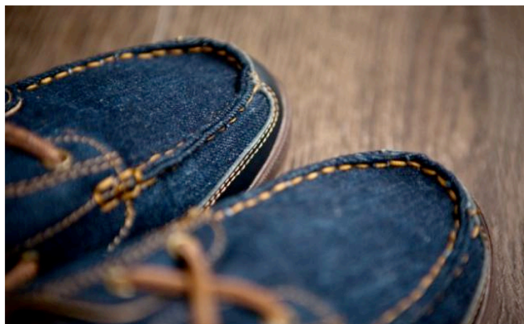
Chaussures bateau Levi's